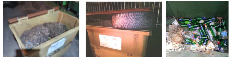
Tonte et pneu dans les bacs d'ordures ménagères Bouteilles dans le bac des recyclables

Continuons de tels agissements dans la gestion des ordures ménagères...mais ne nous plaignons surtout pas de la hausse de leur taxe !!!